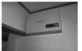
パワーコンディショナー